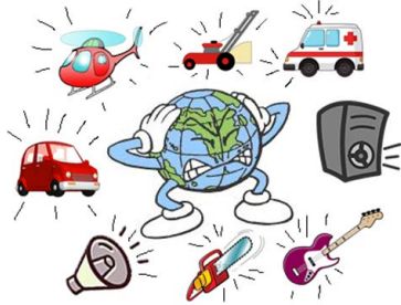
الضوضاء – noise making