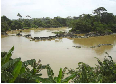
تلوث الماء – water pollution