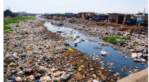
تلوث التربة – soil pollution