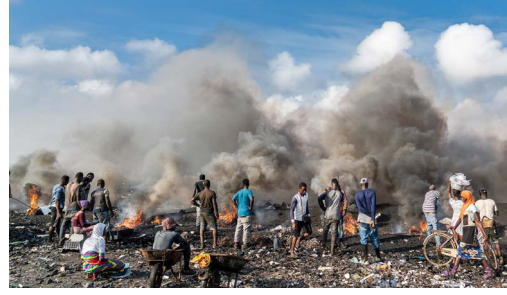
تلوث الهواء – air pollution