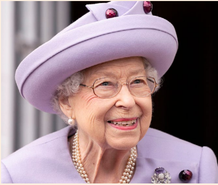
Figure 5.5: Queen Elizabeth II