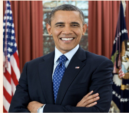
Figure 5.6: Barack Obama