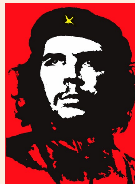
Figure 5.4: Che Guevara