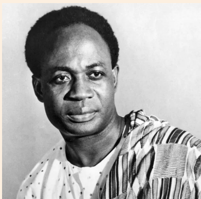
Figure 5.3: Kwame Nkrumah