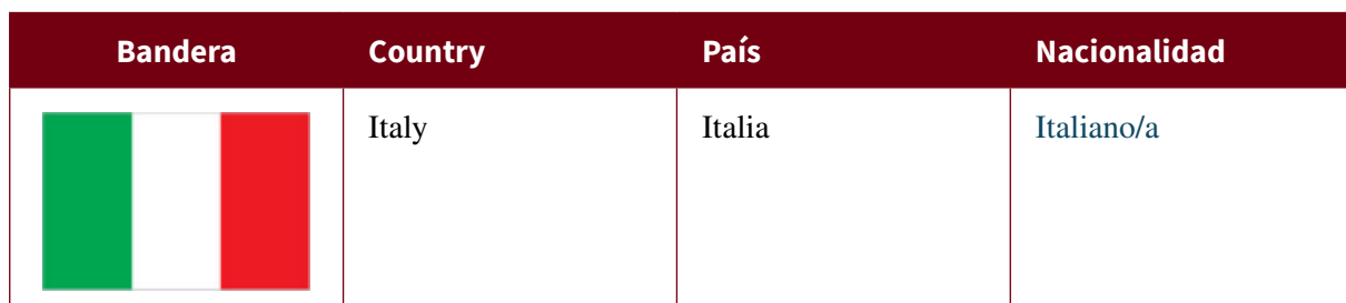
Table 5.2: LAS NACIONALIDADES