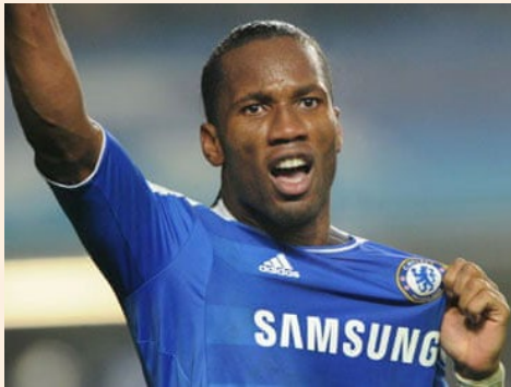
Figure 5.7: Didier Drogba