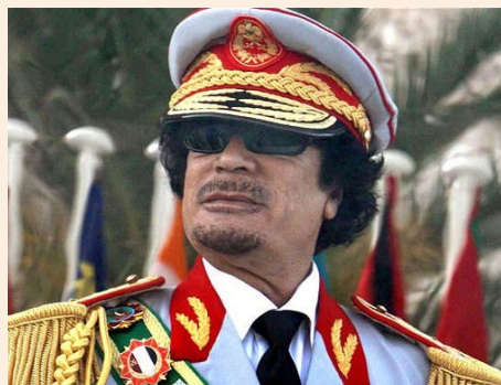
Figure 5.2: Colonel Muammar Gaddafi