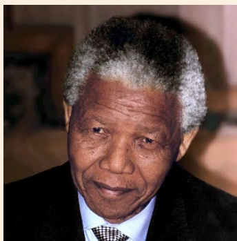
Figure 5.1: Nelson Mandela