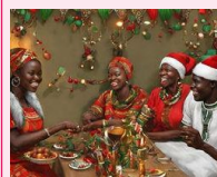
la fête de Noël