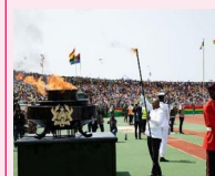
le Jour de l'Indépendance