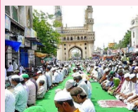
la fête Aïd- el-Kebir