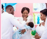
le baptême d'un enfant

Observe, écoute et répète les expressions sous les images.