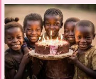
la célébration de mon anniversaire