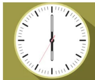
4. LONDRES (LONDON)