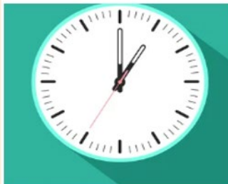
3. NUEVA YORK (NEW YORK)