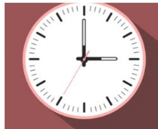
2. TOKIO (TOKYO)