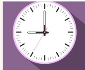
1. MOSCÚ (MOSKOW)

Write the time that appears on each of the clocks below from different places/cities.