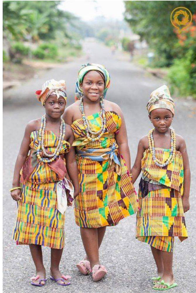
Fig. 6.3. Shows initiate girls dressed in kente cloth after initiation (puberty rites)