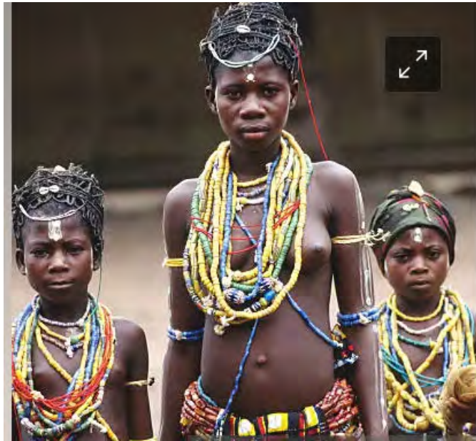
Mfoni 6.2. yi kyere mmaayewa a wɔagoro wɔn bra awie na wode nhwenepa asiesie wɔn ho no bi.

Mfoni a ewɔ fam ha yi ye mmaayewa a wɔagoro wɔn bra awie