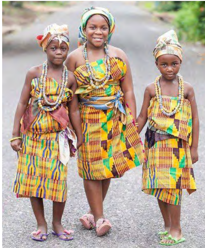
Anfooni. 6.3: wuhirila bipuyimbihɛ ban maali shili ka di nyela be yela kante nɛma biɛhigu soya nyaanɛ