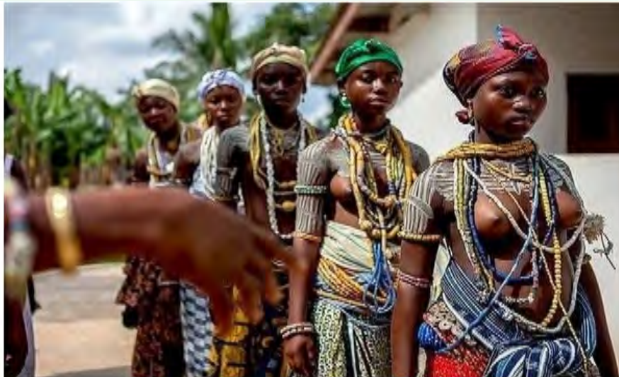
Anfooni ni yi sheli na: Jubtrip as cited in Ndetei (2018).