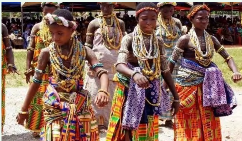
Anfooni ni yi sheli na: Mybrytfmonline.com/Obed Ansah (2021)