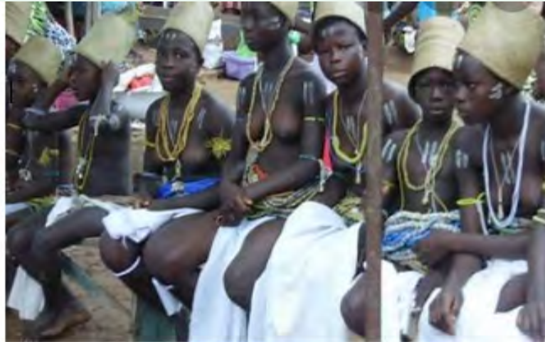
Anfooni ni yi sheli na: cogadfw.org as cited in Ndetei (2018).