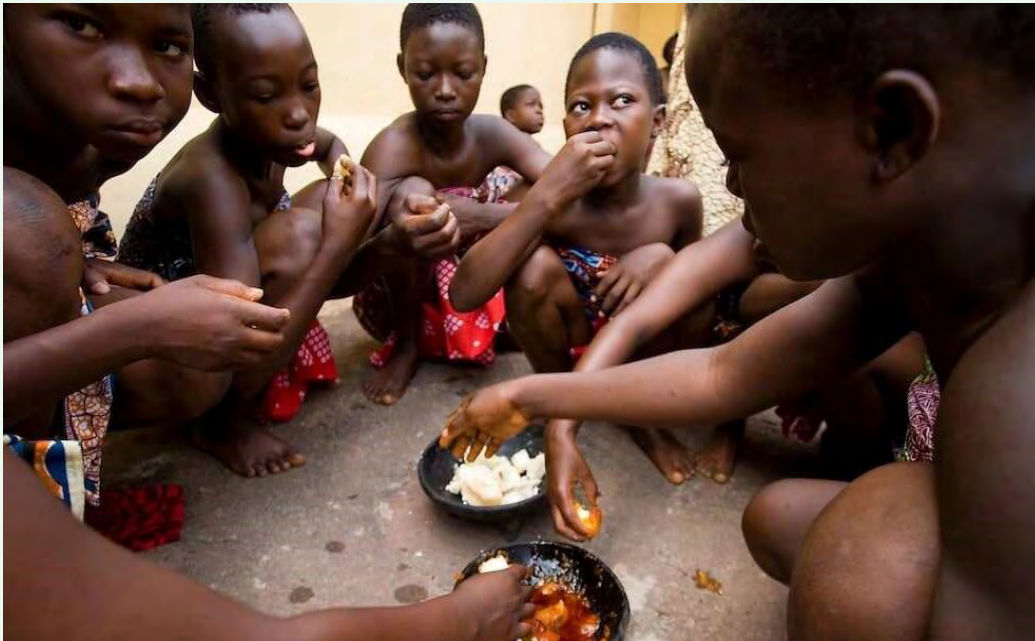
Anfooni ni yi sheli: Olivier Asselin as cited in Ndetei (2018)