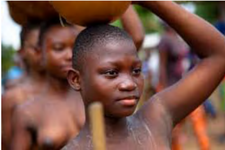
Fig. 6.1: A picture of initiate girls during 'Dipo' spiritual cleansing at puberty rite

Below are some examples of the initiates after the puberty rites