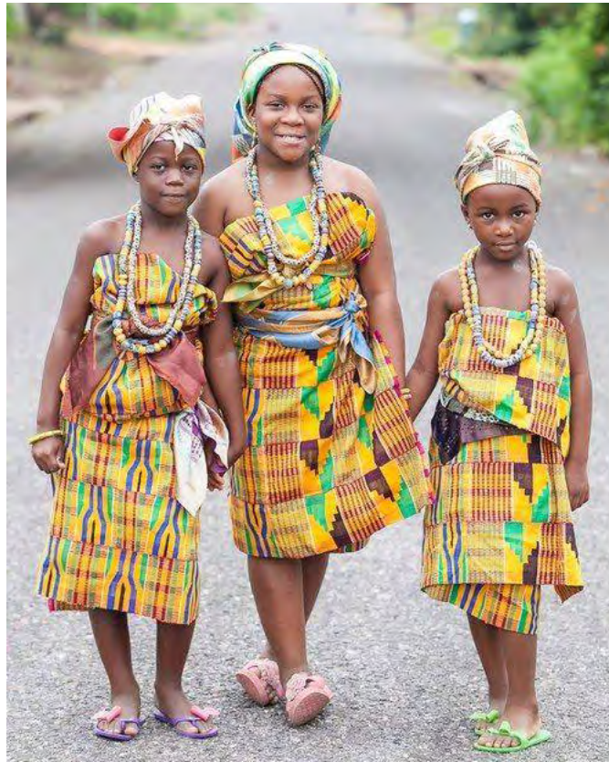
Fig. 6.3. Shows initiate girls dressed in kente cloth after initiation (puberty rites)