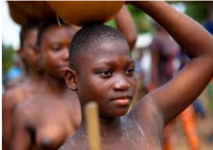
Fig. 6.1: A picture of initiate girls during ‘Dipo’ spiritual cleansing at puberty rite

Busankane selo ba na ke chulu kom ba pa to nyenyero mo tento kuri ne.