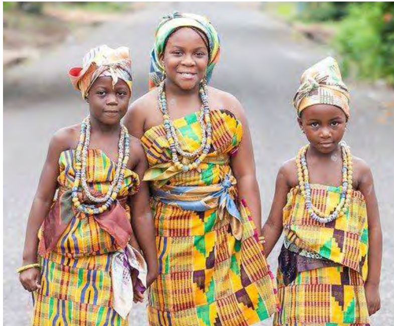
Fig. 6.3: Shows initiate girls dressed in kente cloth after initiation (puberty rites)