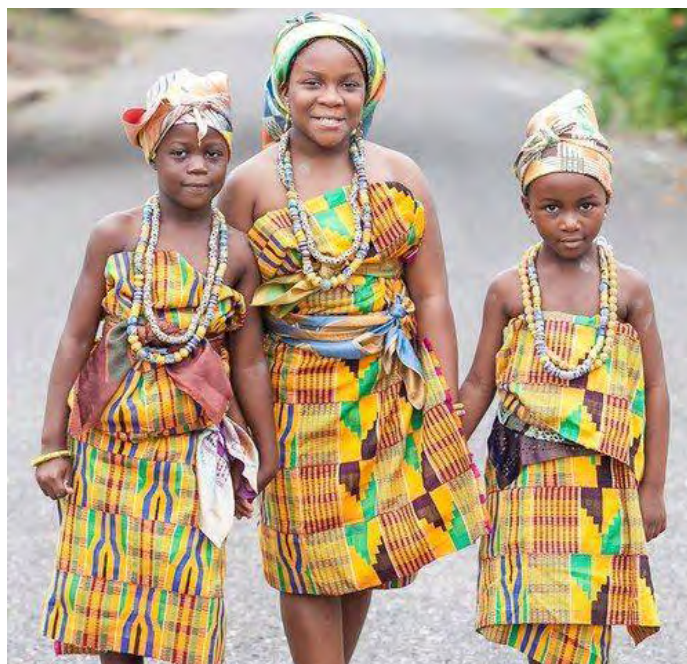
Pon 6.3: Mbasiaba a woefura hɔn kente wɔ ber a wɔagor hɔn bra ewie