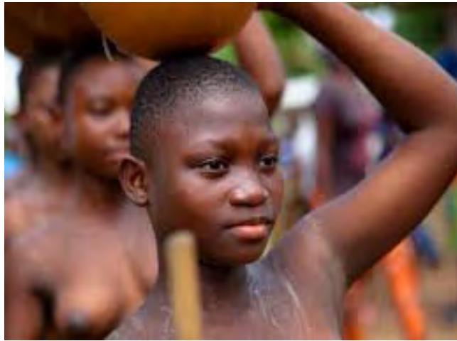
Nvoninli 6.1: Nvoninli ɛhye kile ngakula mraale mɔɔ bɛlua Dipo sunsum nu anwodele maandee adenle zo bezie bɛ aze la.

Nvoninli ɛhye kile ngakula mraale mɔɔ bezie bɛ aze bɛwie la.