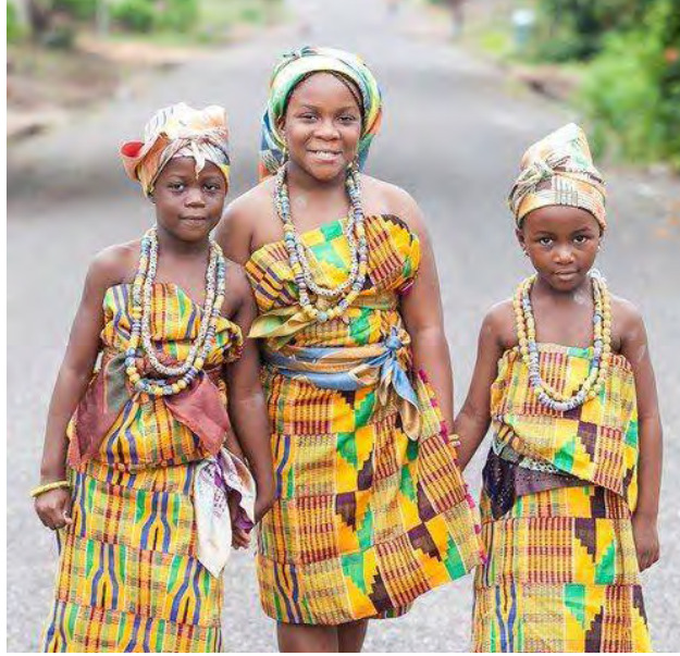
Nvoninli 6.3 Ehye kile ngakula mbelera mɔɔ beva aboka ngakyile bezieie be wɔ meke mɔɔ bezie be aze bewie la.