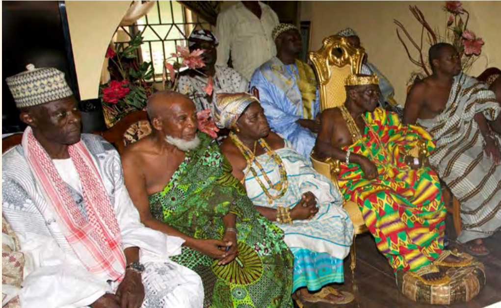
Fig. 7.2: Naba la kiinduma n lagese

Bise foote wa n gā tilum wa suŋa suŋa gee lebese sokere дума la n tagele la: