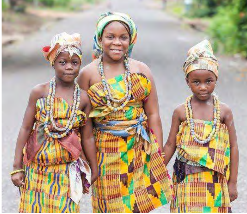
Mfonini 6.3. Eyi kyere mmeawa a wɔagoru wɔn bra awie a wɔde kente asiesie wɔn ho. (bragoru)