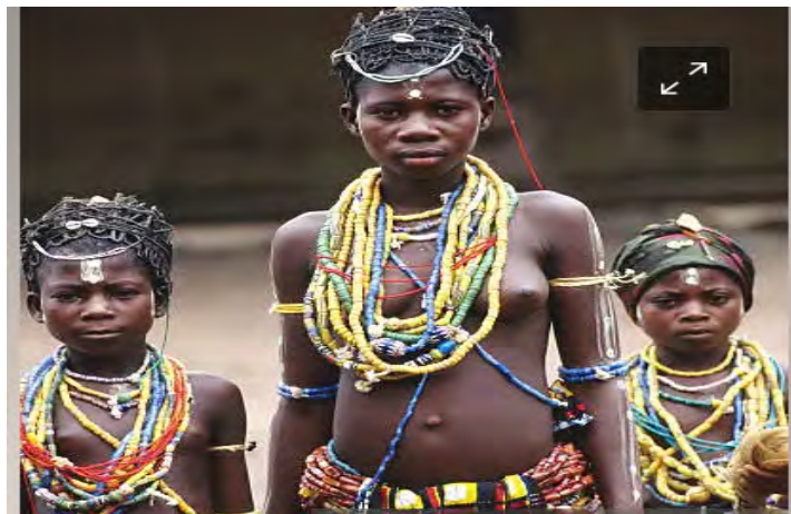
Mfonini 6.2. Mfonini yi kyrere mmeawa a wɔde nhenepa asiesie wɔn ho no bi. (Bragoru)

Mfonini a ɛwɔ fam ha yi ye mmeawa a wɔagoru wɔn bra awie